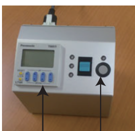
露光スタート スイッチ