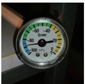
バキュームゲージ付