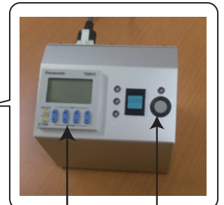
露光スタート スイッチ タイマー設定