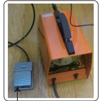
真空ポンプ電源 切替フットバルブ