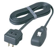
まごの手スイッチ